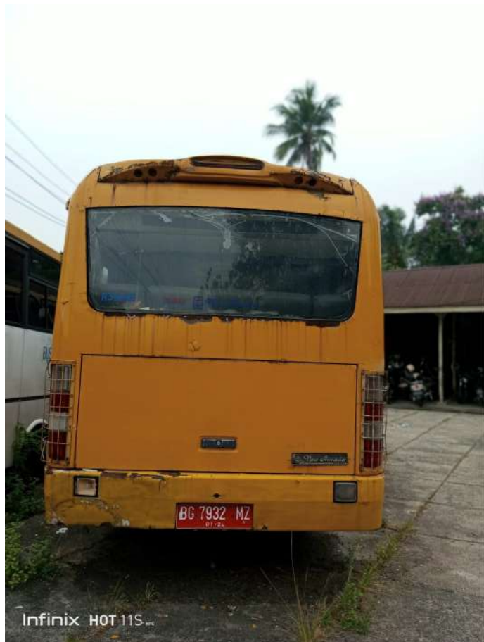
Infinix HOT 11S