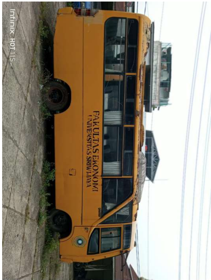
Infinix HOT 11S