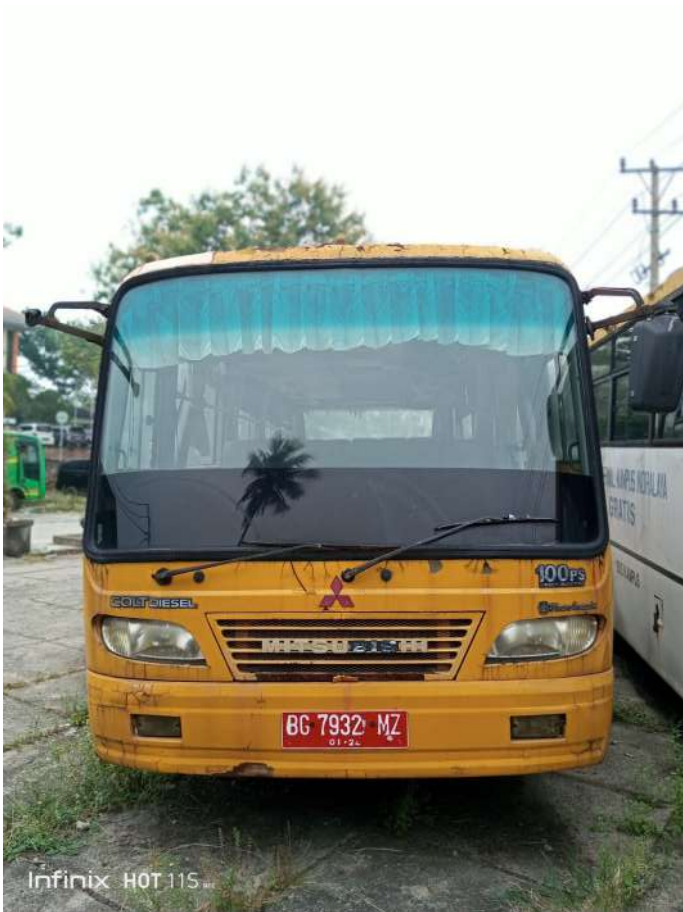
Infinix HOT 11S